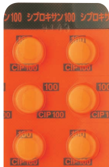
シプロキサン錠100mg (シート)