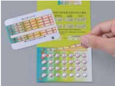
残ったカレンダーシールは不要です。

② カレンダーシールと錠剤シートの矢印に当たって、淡赤色の錠剤から1日1錠ずつ28日間、毎日ほぼ一定の時刻に飲みます。