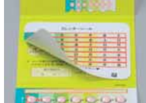
カレンダーシール