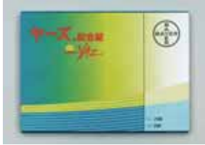
ウォレットパッケージ